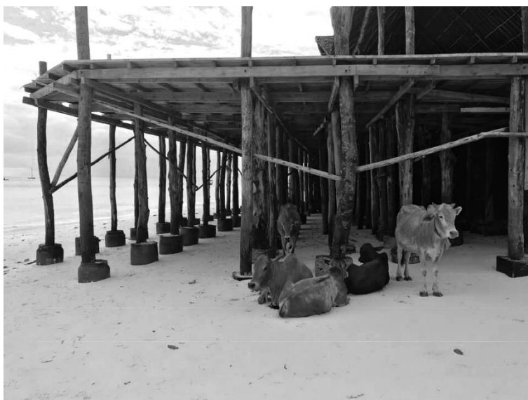
Odpolední siesta, Kendwa beach

V Nungwi jsme strávily 3 dny, poté jsme se přesunuly jihozápadně do vesnice Kendwa, malinké vesničky v kopcích, pod kterou se nachází nekonečné písčité pláže a azurové moře. Mimo jiné tu potkáte také velké množství Masajů, kteří víceméně chodí (respektive běhají) sem a tam, občas něco prodávají, ale většinou si jenom chtějí povídat. Stráví s vámi klidně hodiny a hodiny, sednou si vedle vás na pláži a je skoro nemožné se jich zbavit. Jsou tak divocí a zvláštní, že nás začali nesmírně fascinovat. O jejich kultuře, historii a životě jsme toho v průvodcích ani na internetu moc nenašly, a tak jsme se jim snažily přiblížit a porozumět každým dnem více a více. Myslím, že se nám to povedlo. V Keni jsme měly masajského řidiče, který nás zavedl do původní vesnice, ve které lidé stále zachovávají veškeré tradice. Více o Masajích a jejich kultuře se rozepíšu v článku Afrika III.!