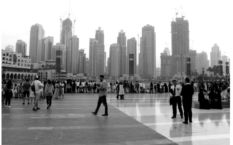
Dubaj, město neomezených možností

Proč právě Afrika? Abych řekla pravdu, sama nevím. Ale něco mě tam lákalo už velmi dlouho, jako magická přitažlivá síla. V dětství jsem byla s rodinou v Tunisku a Egyptě (což, řekněme si upřímně, má už od té „opravdové“ Afriky poměrně daleko), já však stále toužila po pořádném africkém dobrodružství. Na mé osmnácté narozeniny jsem tedy dostala zájezd na Kapverdské ostrovy, kde jsme procestovali ostrov Boa Vista. Po maturitě jsme s mamkou plánovaly nějakou dobrodružnou cestu (respektive já jsem plánovala, mamka pouze s hrůzou v očích projížděla internetové stránky o všech možných i nemožných nebezpečích a celá naše rodina i všichni kamarádi si mysleli, že jsme se naprosto zbláznily). Já jsem samozřejmě chtěla Afriku nebo Jižní Ameriku, která je mým snem již od malička, ale Amerika padla kvůli ceně letenek a Afriku jsme tak nějak odložily. Nakonec jsme jely do Malajsie a Singapuru, což sice vůbec nebylo v plánu, ale poloviční cena letenek a poslední dvě místa v letadle, to prostě bylo jasné znamení. Jely jsme na vlastní pěst a já jsem plánovala celou cestu. Tady jsem si poprvé vyzkoušela, jaké to je a co všechno musí člověk před tak dlouhou a dalekou cestou zařídit. Vše proběhlo naštěstí tak, jak mělo a my jsme si užily úžasnou cestu za méně než poloviční cenu, kterou nabízela cestovní kancelář.