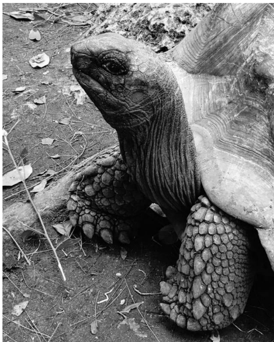
Prison Island, The Big Turtles

Poslední zastávkou na Zanzibaru bylo východní pobřeží, oblast Uroa. Do Uroi jsme přejezdili ze západního pobřeží, cesta trvala asi 45 minut, ale snad každých 100 m jsme pozorovali, jak se příroda mění. Východ Zanzibaru je daleko tropičtější, palmy, banánovníky, sukulenty... Je zde také o něco chladněji a vyskytují se zde časté srážky. Po Nungwi byla Uroa lehkým zklamáním, rozsáhlé písčité pláže zde bohužel nenajdete a tato strana ostrova je navíc typická velkým odlivem. Moře si tedy užijete jen pár hodin denně. I přesto se zde ale vyskytují krásné rodinné penziony a hostely, které jsou hotovým rájem na zemi.