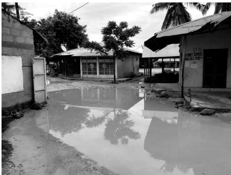
Příjezd do vesničky Nungwi

Po poměrně náročné cestě, kdy nás v Dubaji po dvou nocích téměř bez spánku donutili vystoupit z letadla kvůli poruše motoru, jsme se konečně dostaly na Zanzibar. Letiště bylo přibližně takové, jaké jsem si ho představovala, už jsem po Boa Vistě přibližně věděla, co očekávat. Tady mělo letiště alespoň střechu. Na letišti jsme vyplnily asi 5 různých papírů s často velmi zajímavými otázkami a konečně dostaly víza. Hned po vstupu do "hlavní haly" na nás začali pokřikovat pánové ze směnárny. Tři směnárny vedle sebe a každá jiný kurz, to se jen tak nevidí. Ale prý se v nejuvýhodnější nabídce střídají, tak kdo ví. Domluvila jsem nám řidiče, který nás odveze na ubytování. Nebyl to sice taxikář, ale měl nejlepší hodnocení na TripAdvisor a líbilo se mi jeho jméno, tak jsem se to rozhodla risknout. Nakonec nás vyzvedl někdo úplně jiný, ale na ubytování nás v pořádku dovezl, dokonce i za předem domluvenou cenu.